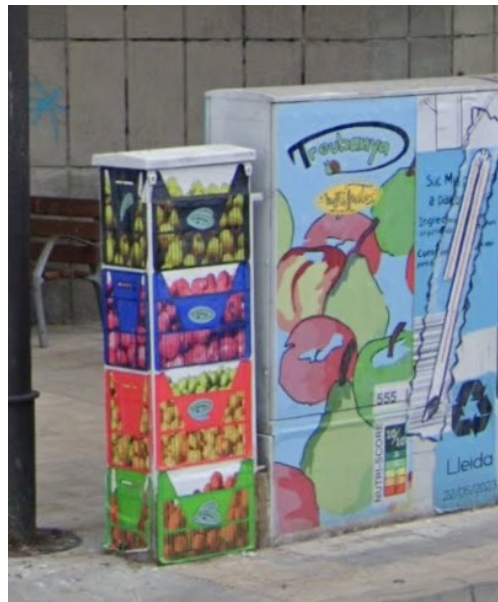
C/ Joana Raspall