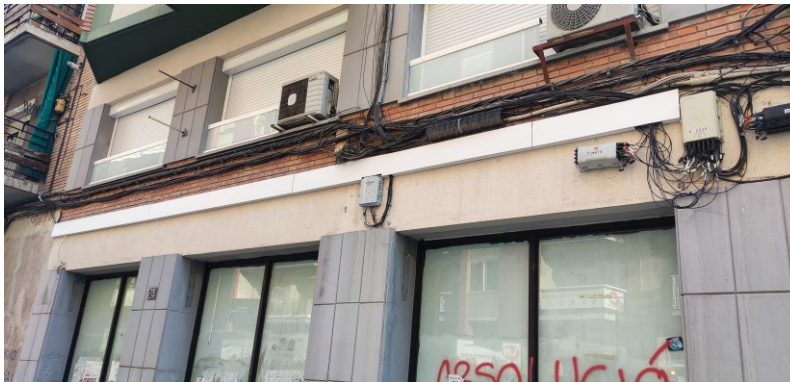
C/ Roca Llaurado 2