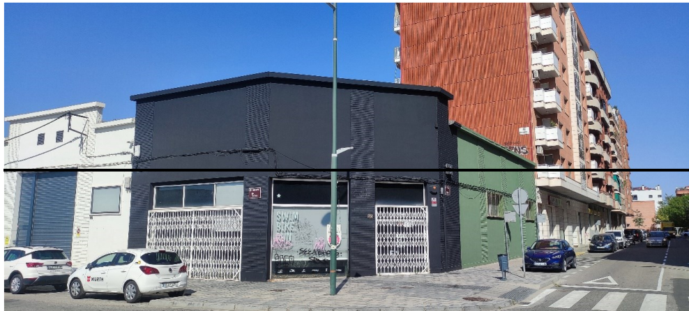
C/ Girona 1