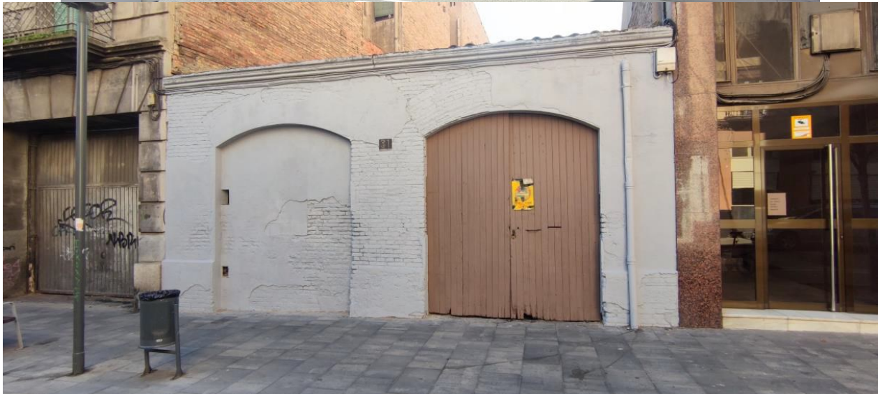
C/ Anselm Clave 31